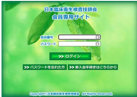
①会員ログイン画面