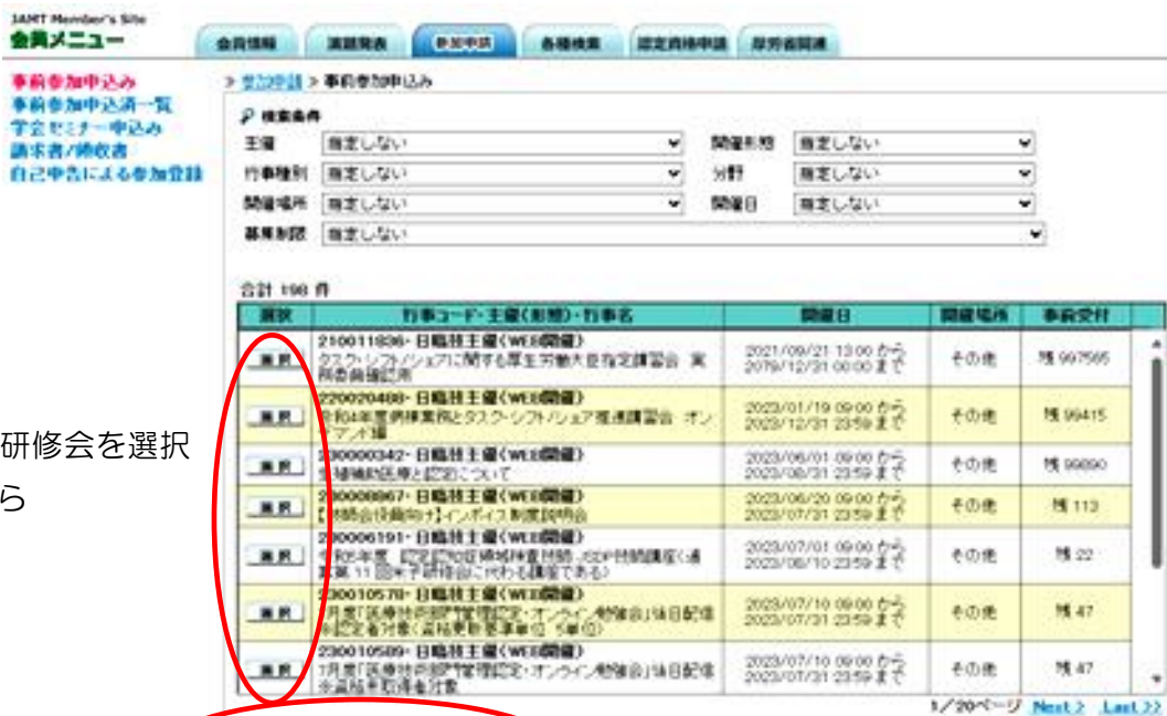
③対象の研修会を選択してから